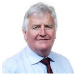
Alun Ffred Jones (Cadeirydd) Plaid Cymru Arfon