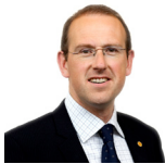
Llyr Huws Gruffydd Plaid Cymru Gogledd Cymru