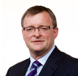
William Powell Democratiaid Rhyddfrydol Cymru Canolbarth a Gorllewin Cymru