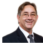
Mick Antoniw Llafur Cymru Pontypridd